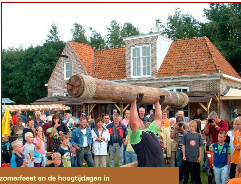
Evenementen als de zwemvierdaagse, het Midzomerfeest en de hoogtijdagen in Openluchtmuseum It Damshûs trekken jaarlijks duizenden mensen naar Nij Beets

Het huidige sportcomplex ligt tussen zwembad en camping in langs het kanaal. Behalve voetbalvelden omvat dit complex een tennisbaan, een jeu de boules baan en een beachvolleybalveld. Dit complex zou uitgebreid kunnen worden met recreatieve functies. Door aan dit complex bijvoorbeeld een midgetgolfbaan, tafeltennistafels en een klimwand toe te voegen, zou er een prachtig recreatiecentrum voor inwoners en toeristen kunnen ontstaan. De ligging tussen zwembad en camping langs het kanaal nodigt uit tot een dergelijke ontwikkeling.