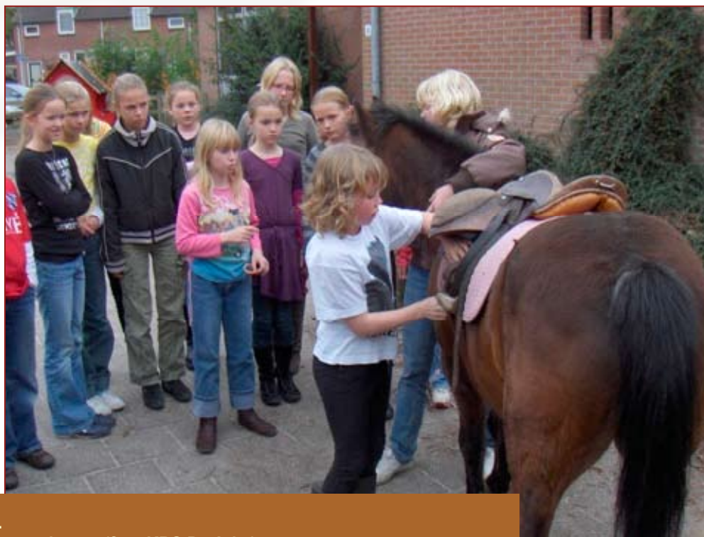
In Nij Beets wonen veel kinderen. Er wonen relatief gezien veel jonge gezinnen.

Nij Beets wenst een BS&MF. Dit gebouw moet uitgroeien tot het huis van Nij Beets waar onderwijs en dorpsactiviteiten optimaal tot hun recht komen. In Nij Beets wenst men voor 2020 deze droom te kunnen realiseren. Plaatselijk Belang acht zo'n centrum van groot belang voor de toekomst van de cohesie en de leefbaarheid in het dorp. Als voorloper op deze BS&MF zal er breed overleg moeten komen tussen potentiële gebruikers. Dit overleg zal uit moeten monden in een gebruikersclub die de plannen verder gestalte moet geven. De organisaties die hierbij betrokken kunnen worden zijn ondermeer Dorpshuis Het Trefpunt, peuterspeelzaal De Krielpykjes, de scholen De Arke, De Jasker en kerkelijk zalencentrum De Rank.