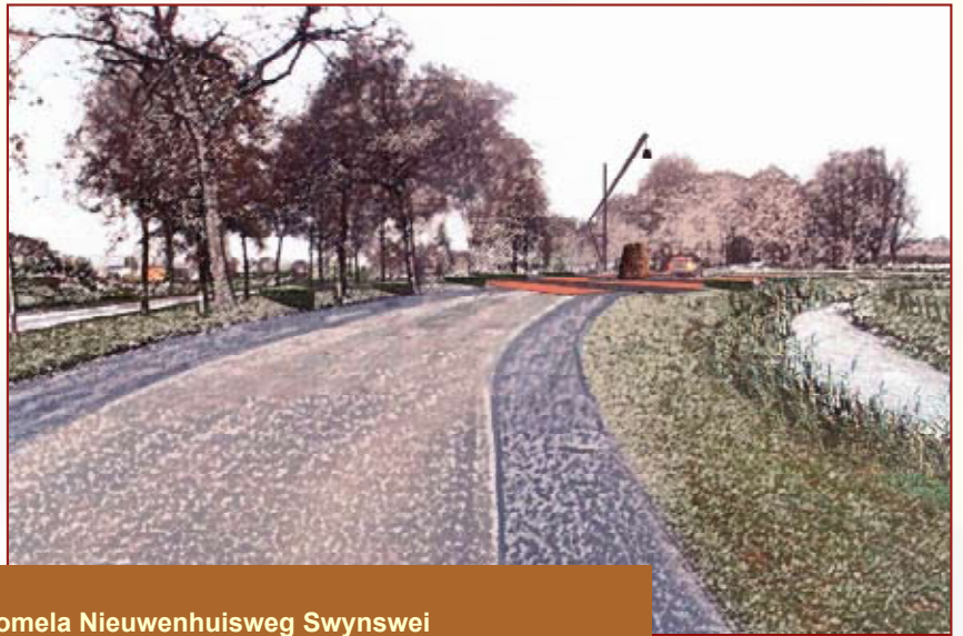
Een artimpression van kruispunt Prikkewei/Domela Nieuwenhuisweg Swynswei

Daardoor wordt het mogelijk om Nij Beets prominenter in beeld te brengen bij passanten. Dit gebeurt al bij het kruispunt-plein Prikkewei/Domela Nieuwenhuisweg/ Swynswei, het kruispunt bij de brug is een tweede kans.