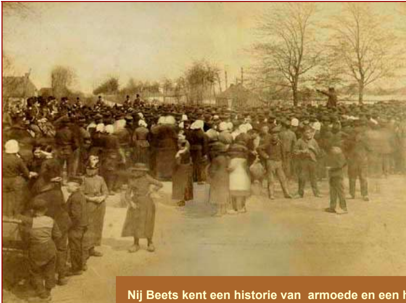
Nij Beets kent een historie van armoede en een harde strijd voor een beter bestaan. Grote en kleinere stakingen voor een beter loon waren vroeger niet zeldzaam.

Nij Beets is ontstaan door hard werken, door wroeten in de grond. De geschiedenis van vervening en inpoldering hebben het dorp gemaakt tot wat het nu is. "Strijdbaarheid" en 'meiinoar ien" zijn kernbegrippen uit de Beetster historie. Wie nu door het dorp rijdt vindt deze geschiedenis nauwelijks terug. Feitelijk is het huidige Nij Beets een verzameling gebouwen, zonder dat daar een eigen karakter uit spreekt. Wil het dorp aantrekkelijk blijven voor de inwoners en interessant worden voor de toeristen, dan is verandering noodzaak. Nij Beets is dringend toe aan een kwaliteitsimpuls.