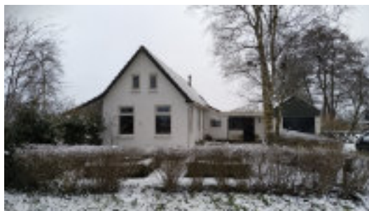
Het huis in de sneeuw

Wel een kleine kanttekening van Hidido: “het waait hier altijd aan deze kant van het dorp.”