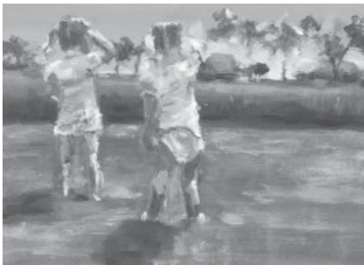
De twee kleindochters in de tuin van pake en beppe