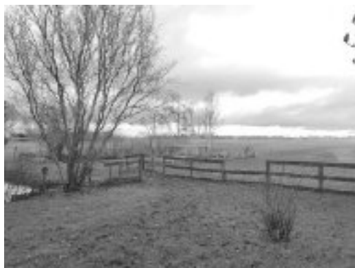
Hun uitzicht aan de achterkant van het huis