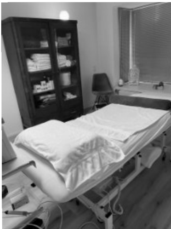
De praktijkruimte (Foto Renny Brouwer).

Het aantal behandelingen hangt geheel van de klachten af en hoelang die er al zijn. Sommige cliënten komen regelmatig voor een soort onderhoud om klachten te voorkomen. "Ik zorg er wel voor dat mensen niet onnodig lang in behandeling blijven door regelmatig te evalueren wat nodig en gewenst is."