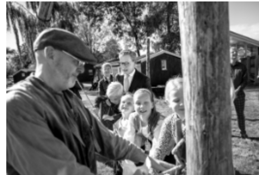
Op bezoek bij het Damshûs

De eerste periode na de installatie stonden in het teken van kennismaken met de gemeente. En hierbij is hij begonnen in Nij Beets (red: ondanks dat de gehele gemeente prachtig is, begrijpen wij deze keuze) met een bezoek aan het Damshûs. Hier werd duidelijk dat Nij Beets een prachtige historie heeft en dat deze herkenbaar is.