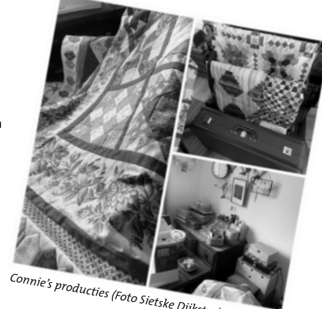
Connie's producties

Er kan veel met de naaimachine gedaan worden maar er komt ook heel veel handwerk bij te pas. Heel veel manieren op het door te stikken krijg ik te zien. Met de naaimachine in de vrije stand waardoor de stoffen makkelijk bewogen kunnen worden maar ook het aan elkaar zetten van de verschillende vormen kan met de hand. Connie laat me een ontwerp zien waarbij ze van stevig papier vormpjes knipt, waar stof omheen wordt geplakt. Dit is een Engelse manier. Als voorbeeld laat ze een zeshoekige vorm zien. Daarom heen komen weer punten waardoor er uiteindelijk een bloem ontstaat. Allemaal met papier in de stof. Zodra alles aan elkaar zit en verwerkt is kan het papier verwijderd worden. Deze techniek zorgt ervoor dat de vormen stevig blijven en niet kunnen verschuiven en trekken. Als de bovenste laag klaar is, komt er een zachte tussenlaag, waarna de achterkant aangebracht wordt. Dan begint het doorpitten van de gehele deken. Het